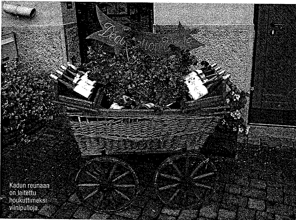
Kadun reunaan on laitettu houkuttimeksi viinipulloja.

eli paistettua hanhenmaksaa. Tämä kuuluisa gourmet-herkku on erikoinen makuelämys: pinnalta ruskean rapeaksi paistettu sisäelin on sisältä maksalle tyypillisen pehmeää ja sileää, mutta maku muistuttaa savua, jopa hikeä. Ensikertalaiselle kokemus hanhenmaksasta saattaa olla vähintäänkin outo.