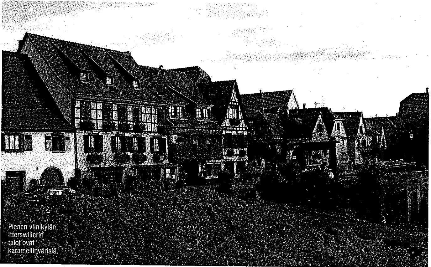
Pienen viinkylän, Itterswillerin talot ovat karamellinvärisiä.